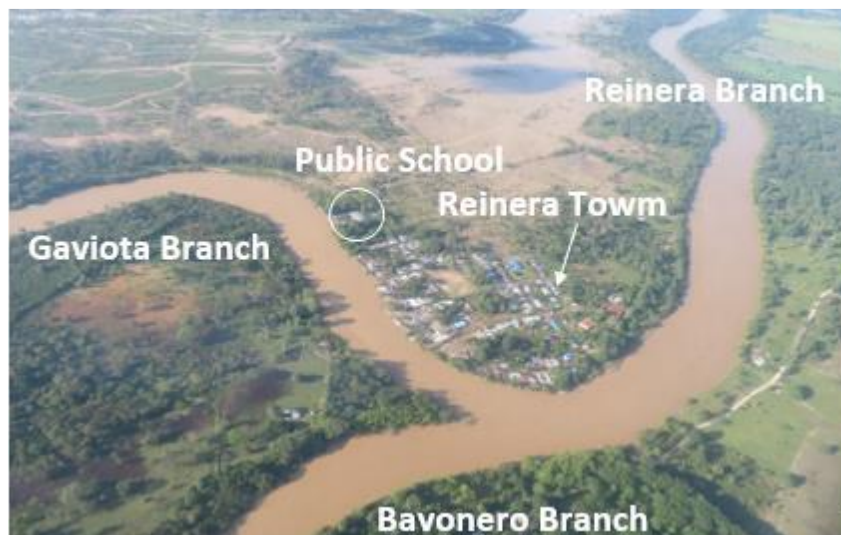
Figura 6. Ramales Confluencia Gaviotas - Bayonero - Reinera en la localidad de Reinera

El brazo Gaviotas del río Arauca corresponde a una afluencia histórica anterior a 1950, y también fue generado por avulsión. El cauce vuelve luego al Arauca por el Caño Reinera en el centro poblado de Reinera, el cual se desarrolló sobre el albardón o dique natural del curso de agua Gaviotas-Reinera (ver figura 6). En esta localidad se une el difluente Bayonero los otros dos forman lo que se conoce como la “Isla Gaviotas” antes mencionada.