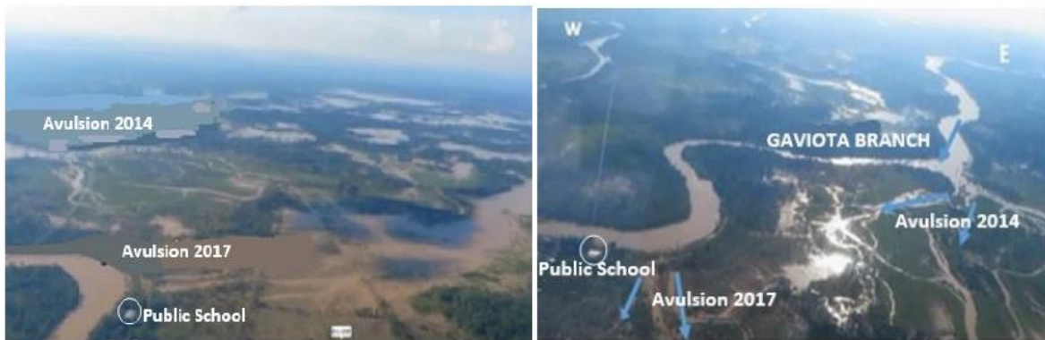
Figura 7. Brechas en el ramal Gaviotas aguas arriba de la localidad de Reinera

atestiguan el proceso dinámico de difluencia en la llanura de inundación de Arauca generando mayor riesgo para la población y la infraestructura.