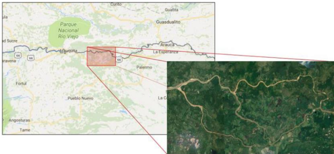
Figura 2. Río Arauca. Ubicación del sector de estudio (Franco, 2018)

El tramo Boca Gaviotas se encuentra constituido por los brazos Gaviota y Arauca (ver figura 2); además, su condición inicial era caracterizada en que la mayoría del caudal se dirigía al brazo Arauca (el cual limita la frontera con Venezuela), en contraste un pequeño porcentaje fluía por el brazo Gaviota. Lo que demuestra un comportamiento inusual del río, puesto que gran parte de su caudal fluye por el brazo Gaviota (Franco, 2018).