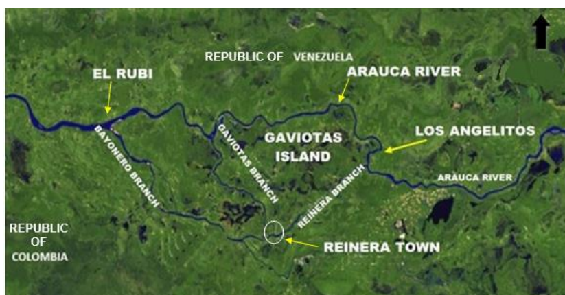
Figura 4. Avulsión sistema Bayonero, Gaviotas-Reinera

Un caso bien documentado de avulsión, fenómeno característico de los sistemas de drenaje distributivo, corresponde al llamado “Brazo Bayonero”, generado en la década de 1950 desde el cauce principal del río Arauca, hacia Colombia, el cual tuvo un impacto significativo, pues de la reducción de la descarga al curso principal del río, definiendo la frontera entre Colombia y Venezuela. El desvío de caudal generó un incidente diplomático, y posteriormente una intervención de dragado a gran escala por parte de Venezuela, para recuperar el caudal de agua hacia el cauce principal.