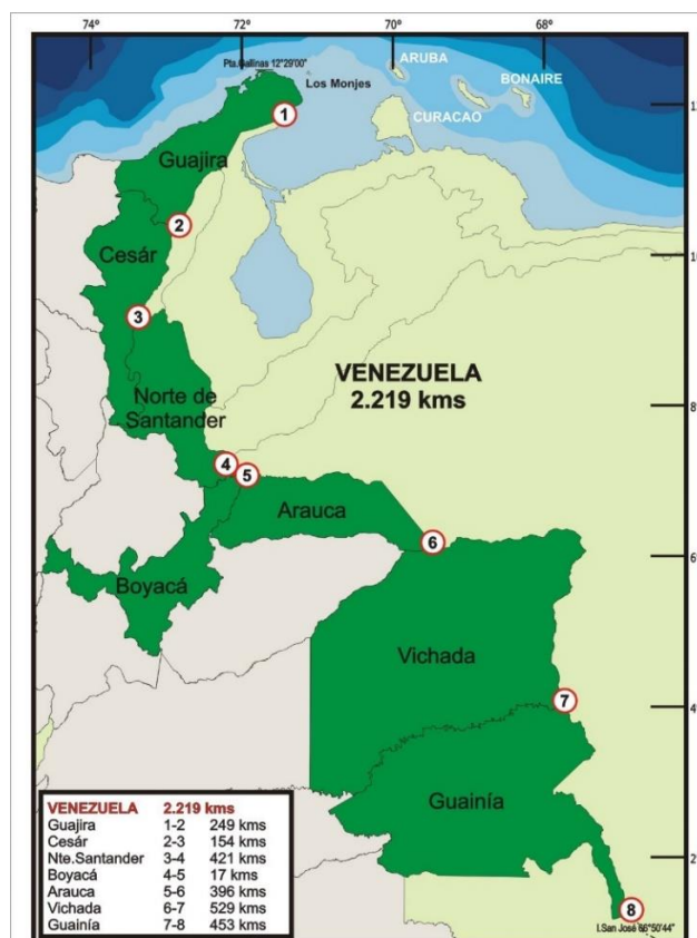
Figura 1 Mapa digital Integrado (Sociedad Geográfica Colombiana. Atlas de Colombia 2002)

Esta extensión que según indica la Sociedad Geográfica Colombiana (2022) inicia desde el municipio de Castilletes, en el norte de la Guajira y finaliza en la Isla San Jorge en el sur del Departamento del Guainía,